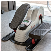
ミニフィットネスバイク